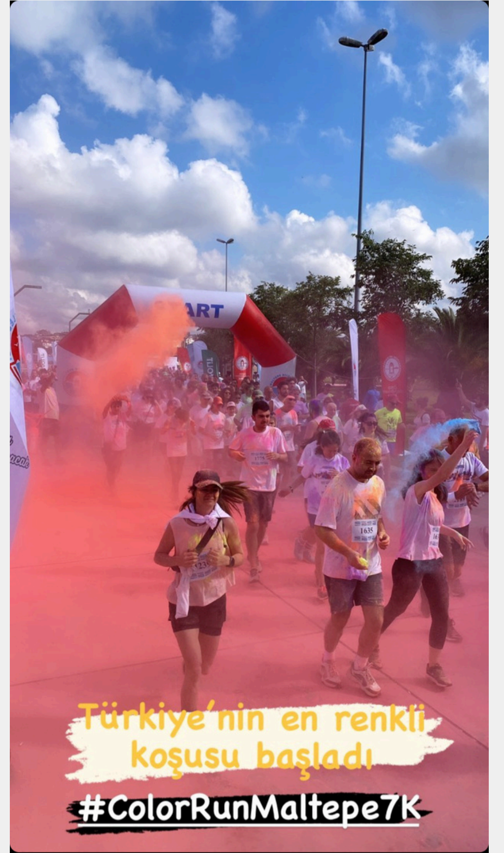
Türkiye'nin en renkli koşusu başladı #ColorRunMaltepe7K